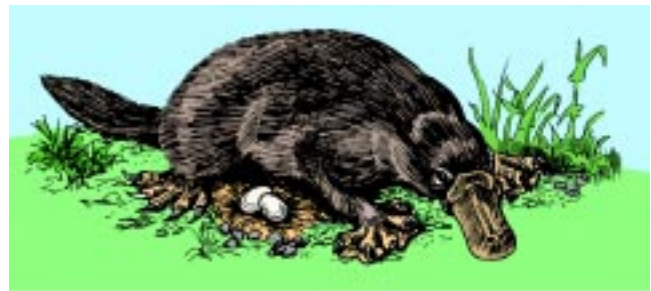
Abb. 4: Paß nicht gut in einen Stammbaum: Das Schnabeltier vereinigt in sich Säugermerkmale (Milchdrüsen, Haare), Reptilienmerkmale (legt Eier) und ein vogelähnliches Merkmal (Hornschnabel). Als Spezialität besitzt es als wasserlebendes Tier außerdem einen Ruderschwanz und Schwimmhäute.

Die hier kurz geschilderten Argumente werden in „ Evolution – ein kritisches Lehrbuch “ ausführlich behandelt.