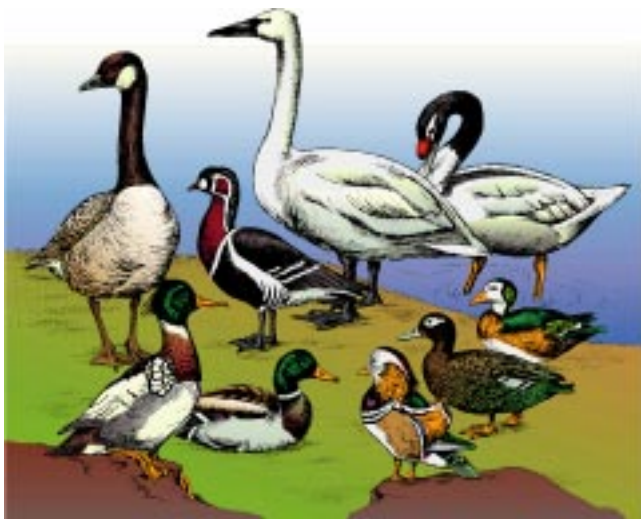
Abb. 2: Die Entenartigen als Beispiel für einen Grundtyp. Zu einem Grundtyp gehören alle Arten, die direkt oder indirekt (über eine dritte) Art kreuzbar sind (also Mischlinge bilden können).